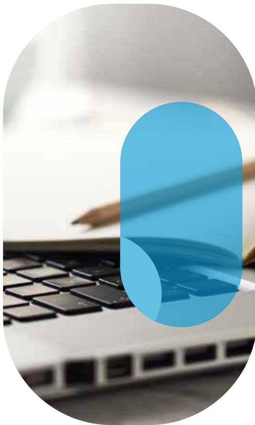
Table of content

We chose the name “Misk AlDar” because we believe that our services and technical team leave a pleasant, lasting impression in every home. We provide high-quality services that make every house more comfortable and refreshing.